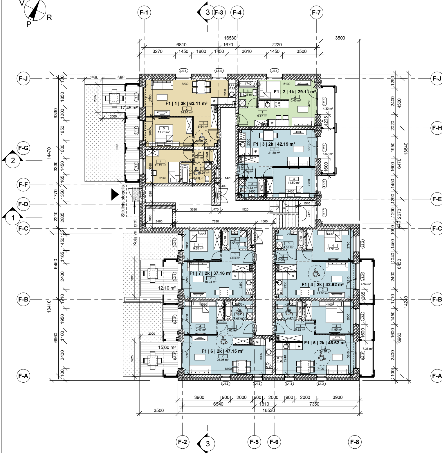
F1 | 1 | 3k | 62.11 m 2